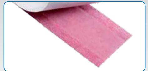
Beidseitig klebstofffreier Randstreifen