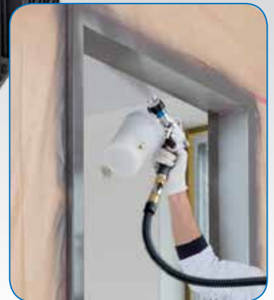
360°-Einsatz - auch über Kopf