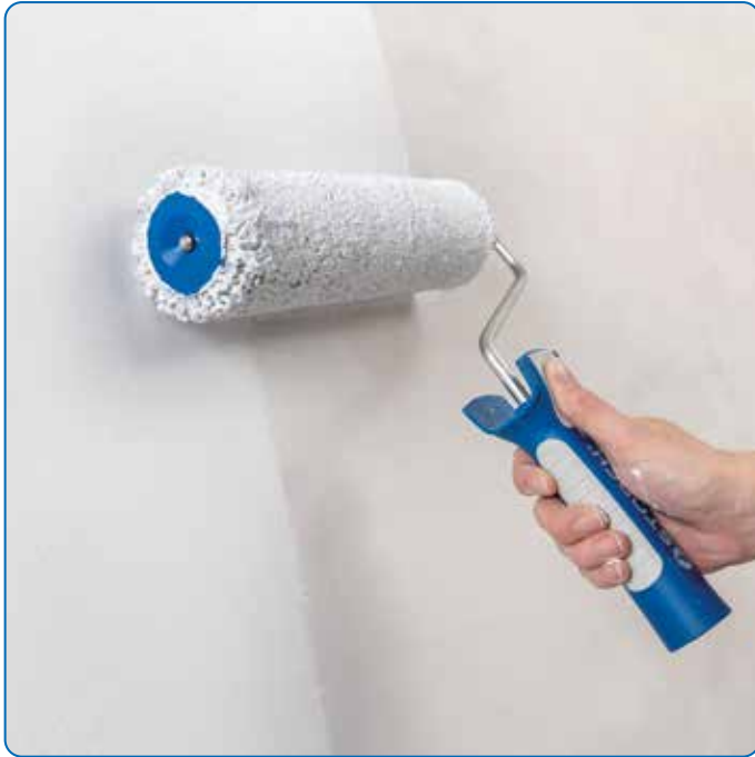
Effiziente und streifenfreie Beschichtung, auch auf größeren Flächen.