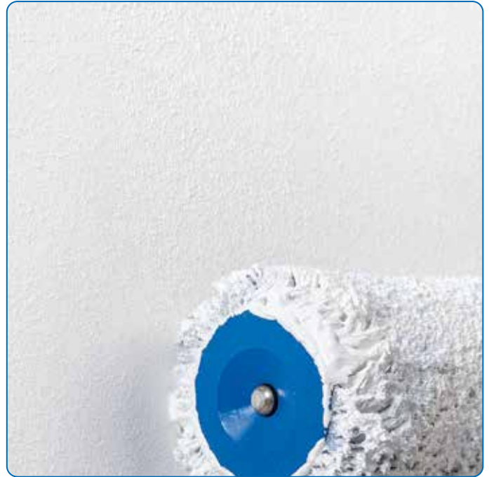
Optimal geeignet zur Beschichtung glatter Untergründe mit feinstem Oberflächen-Finish.